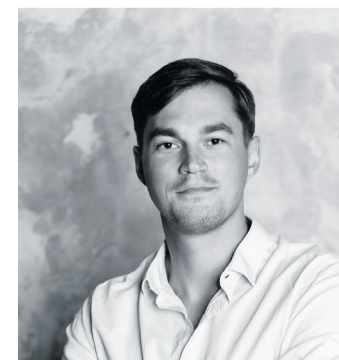
Autor: Joosep Veerme, Energiaühistu juht

vad toetust nii kohalikud omavalitsused kui ka tuuleparkide lähedal asuvad majapidamised. Näiteks kuni 250 meetri tipukõrgusega tuuliku puhul on tuuliku tasu ette nähtud kahe kilomeetri raadiuses asuvatele majapidamistele ning üle 250 meetri kõrguste tuulikute puhul laieneb see raadius kolme kilomeetrini. Kohalikule omavalitsusele laekuv tuulikutasu tähendab, et tuuleparkide rajamine toob piirkonda täiendavat majanduslikku kasu ja arengut. Lisaks tekivad uued töökohad ja taskukohase energia kättesaadavus loob veelgi rohkem võimalusi kohaliku majanduse arenguks.